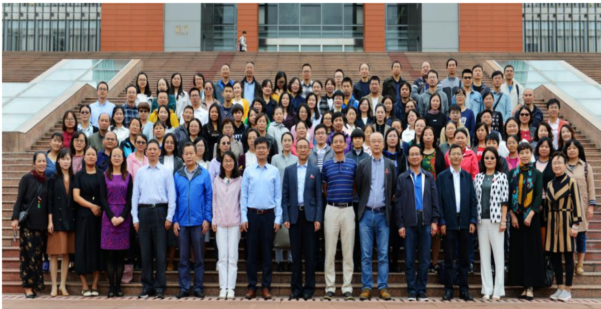
(昆明理工大学图书馆 供稿)

进行了研讨。来自清华大学、云南大学、昆明理工大学图书馆的老师及睿唯安学术研究事业部业务总监分别在研讨会做了主题发言。会议的召开对云南省高校图书馆的学科服务和图书馆事业的发展起到了有力的推动和促进作用。